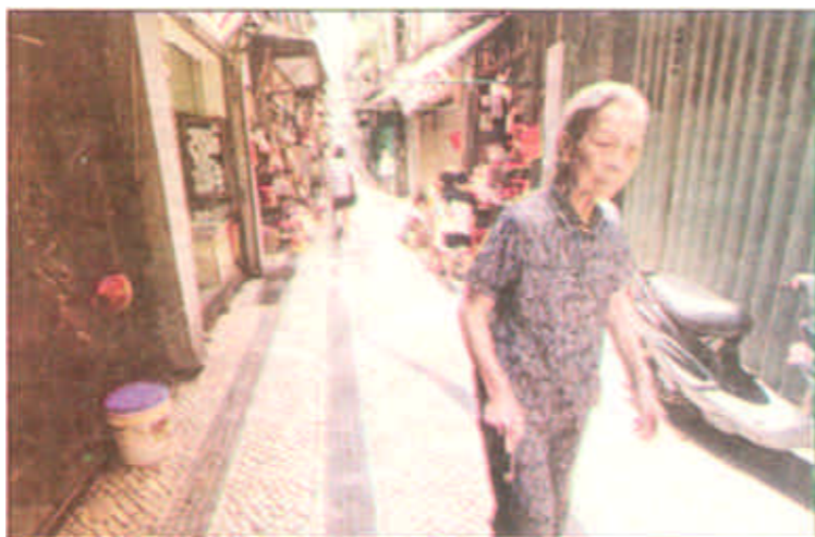
澳门的老街道是寂静的，即使在白天也见不到多少行人。这位行走在葡式街道上的老太太目睹了近一个世纪的澳门。