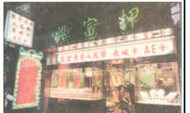
夜晚，澳门的典当行店铺是营业时间最长的。