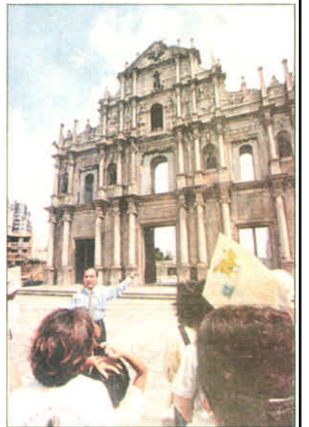
澳门大三巴牌坊是圣保罗教堂残留前壁的俗称，建于1602年。1835年一场大火，使教堂只剩下前壁，孤零零如同一座牌坊。大三巴已成为澳门的象征。