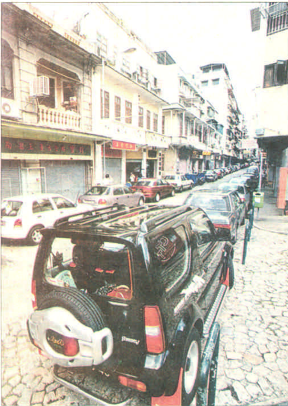
找一个停车场所花费的时间比行走时间还要多。澳门的汽车密度在世界名列前茅。全澳门马路只有90多公里，汽车却有三四万辆。