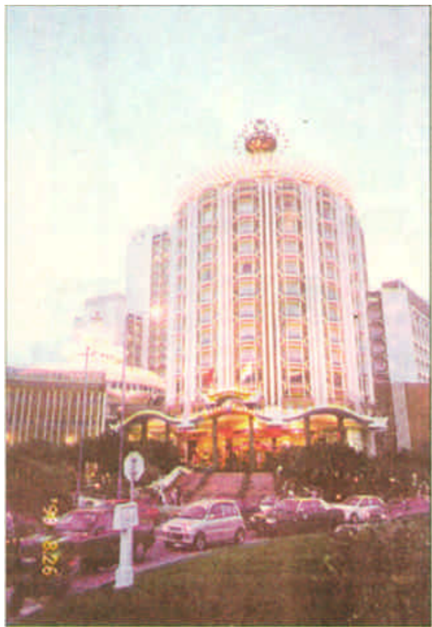
澳门最大的五星级酒店葡京大酒店内设澳门最大的赌场葡京娱乐城。酒店主建筑设计非常独特，外形像一只鸟笼。人们把进葡京戏称为进鸟笼，意为进去容易出来难。