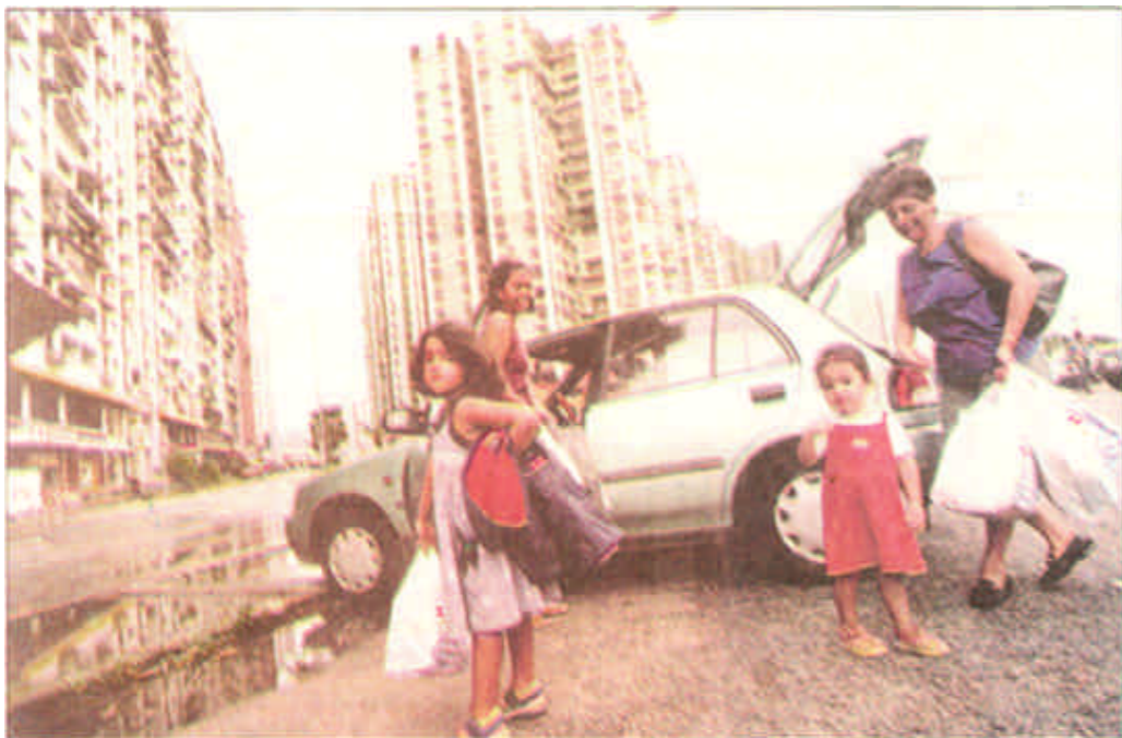
在澳门，1万多“土生葡人”成了较为特殊的群体。他们在澳门出生，是具有葡萄牙血统的葡籍居民。他们大多被华人文化同化了，因而有人戏称他们是手持葡国护照却不会讲葡语的人。