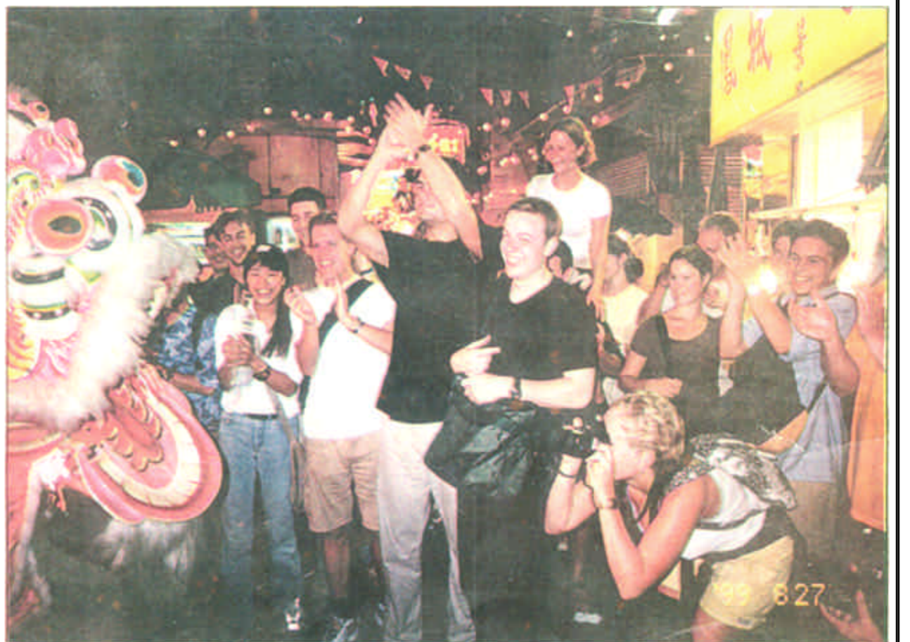
世纪庆典到来之前。