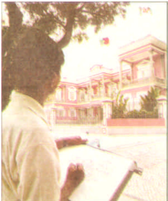
澳门总督府。1999年12月20日，第127位澳督韦奇立将离开这座葡式建筑。

澳门的公园，除卢廉若公园收费1元外，全部免费开放。公园里有供市民和游客阅览书报的图书馆。