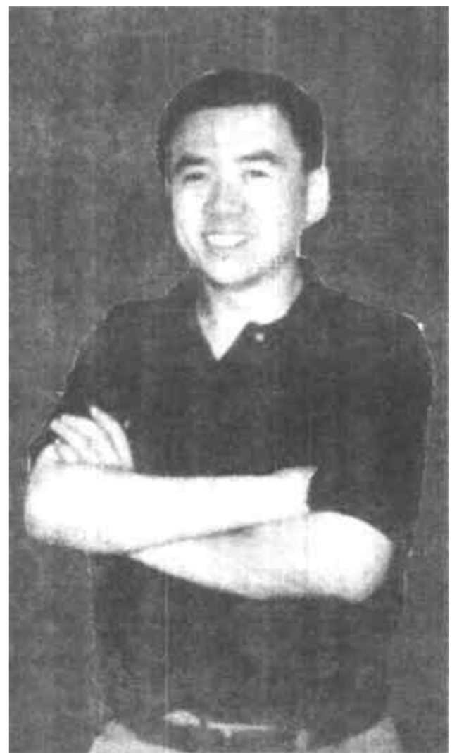
永无立足之地。我是一名设计师，这是我的职责所在。”

“设计是一门引导人的艺术。一个好的设计能够对人们审美情趣的提高起到促进作用，但一件好的设计作品的出现，往往与设计师所拥有的艺术修养密不可分。如果好的设计逐渐增多，人们的审美观点转变后，那些俗陋的设计在商品市场上将