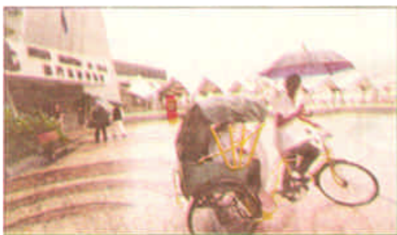
乘坐澳门人力三轮车的价格要比出租车高出几倍。