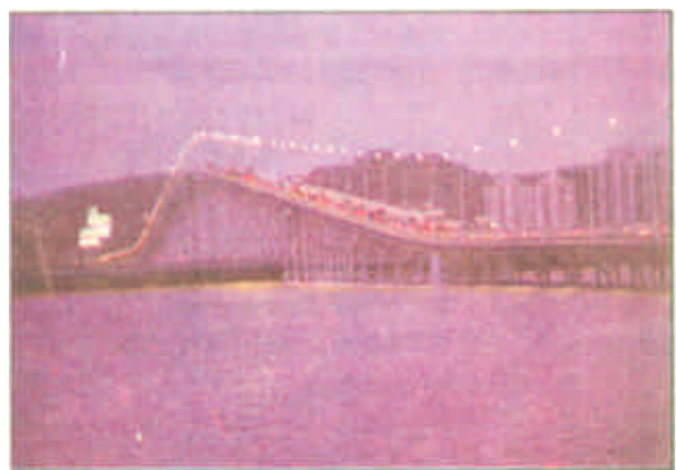
澳凼大桥——连接澳门半岛和凼仔岛的跨海大桥。它宛如长虹卧波，雄伟又不失秀气。大桥1974年10月建成，高35米，全长2569.8米，堪称当时世界上最长的连续桥。